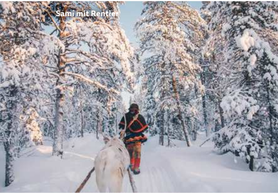
Sami mit Rentier