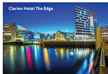
Clarion Hotel The Edge

2. Tag: Tromsø. Reisen Sie mit einem Team von tatkräftigen Alaskan Huskys durch den Schnee. Sie werden begeistert sein, mit welcher Ausdauer und Motivation die Hunde Sie im Schlitten durch die eindrucksvolle Landschaft ziehen. Sie haben die Wahl als Gast im Huskyschlitten mitzufahren oder einen eigenen Schlitten zu steuern. Interessieren Sie sich für die arktische Tierwelt, dann ist eine Wildlife Safari oder eine Walbeobachtungstour genau das Richtige. Am Abend sollten Sie sich Zeit für das Nordlicht nehmen. Bei gutem Wetter erleben Sie dieses Naturphänomen z.B. am gemütlichen Lagerfeuer (alle Ausflüge optional zubuchbar). (F)