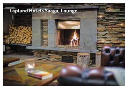
Lapland Hotels Saaga, Lounge